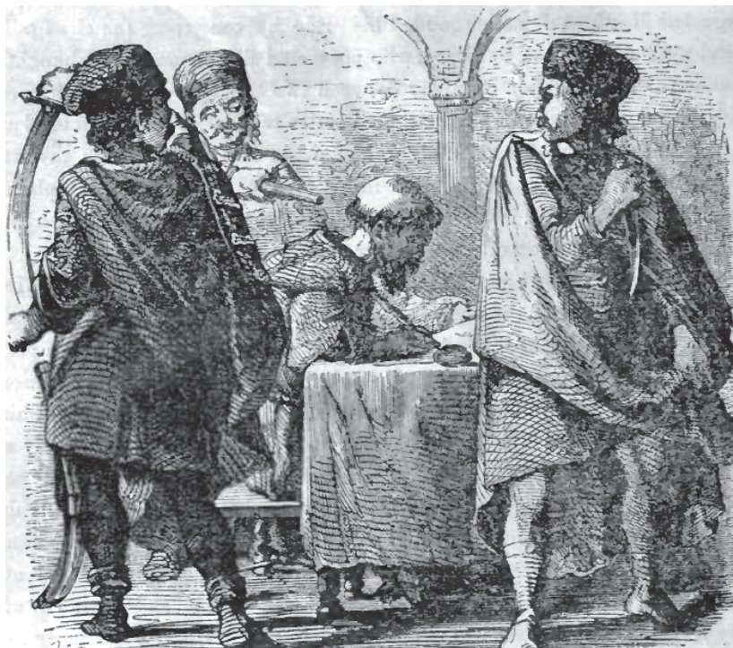
Edwin Lawrence Godkin 1853-ban kiadott könyvében megjelent illusztráció

lovon, fehér ruhában és bíborosi kalapban a hadsereg vezetőjeként ábrázolja, s a kép fölött a bíboros címere is megtalálható.