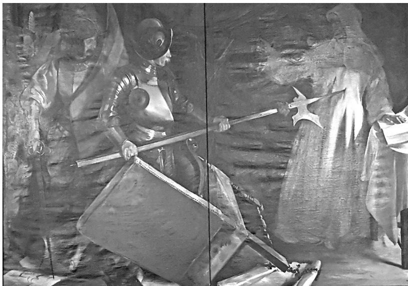
Istókovits Kálmán festménye (SVI, 1. sz. 3991.)

az 1930–40-es évekből származik. 41 Eme ábrázoláson a gyilkosság pillanata látható. Egy lépcsősor tetején a fehér pálos ruhában lévő, tonzúrás barátot egy talpig páncélt viselő zsoldos törével szúrja hátba, miközben Fráter kezéből éppen kihull egy vaskos könyv. Érdekes módon e képen is feltűnik a szemináriumi festmény két fontos részlete: a bal oldalon található nagy lepel, valamint a jobb oldalon elhelyezett fegyverek.