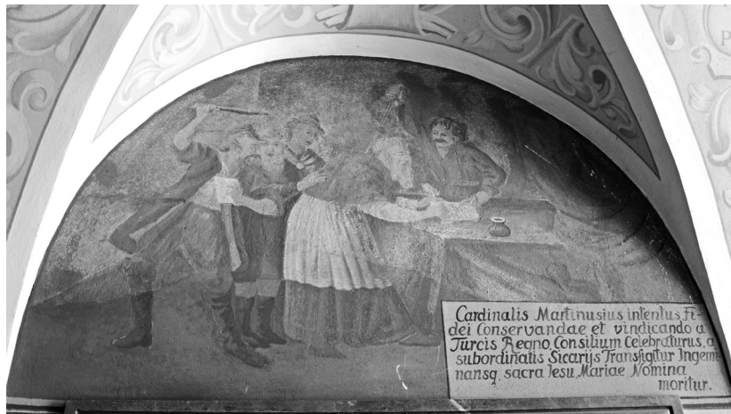
A częstochowai kolostor előcsarnokában található festmény

kastélyában lévő festményről, amely feltehetően Fráter György egykorú ábrázolása. 4 Eme ábrázolásra kísértetiesen hasonlít a Loire menti Beauregard ősi kastélyának középkori és kora új-kori államférfijait bemutató festménysorozatában található Fráter-portré. 5 E képen nagyváradi püspökként és kardinálisként nevezik meg Frátert, aki fehér ruhája felett vörös köpönyeget visel. A Magyar Nemzeti Múzeum Történelmi Képcsarnoka is őriz egy mellképet, ahol csak bajuszt, valamint egy teljes alakos festményt, amelyen bajuszt és szakállat visel a barát. Mindkettő 18. századi eredetű, alkotóik ismeretlenek, annyi azonban közös bennük, hogy mindkét képen bíborosi öltözetben látható Fráter György. 6