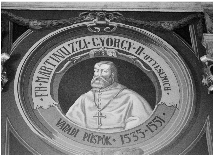
Id. Storno Ferenc Fráter György mellképe a nagyváradi püspöki palota dísztermében

az esztergomi érseki címet is. Mindezt azzal érdemelte ki, hogy hosszú, kitartó munkával sikerült I. Ferdinánd uralma alatt újra egyesítenie a keleti országrészt a királysággal, eközben pedig a várható oszmán támadást is késleltetnie.