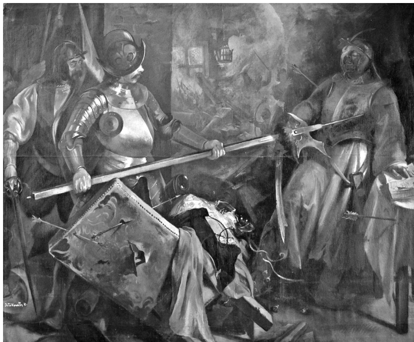
Istókovits Kálmán 1951-es festménye (SVI, 1. sz. 32.)

A siklósi vármúzeum gyűjteményében található egy olajfestmény, amely a leltár szerint az 1930–40-es évekből származik. 43 E kép alapkoncepciójában az utóbbi tondóvázlatot tükrözi vissza: egy spanyol vértezettben lévő zsoldos alabárdal döfi le a sarokba