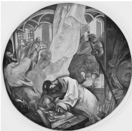
Istókovits Kálmán 1947-ben készült festménye a Központi Papnevelő Intézetben

éppen levelet ír a támadás közben – e csoportba tartoznak Istókovits Kálmán alig ismert művei. Ezek között viszonylagos ismertséggel a címben is említett, 1947-ben a budapesti Központi Papnevelő Intézet földszintjén készített festmény bír.