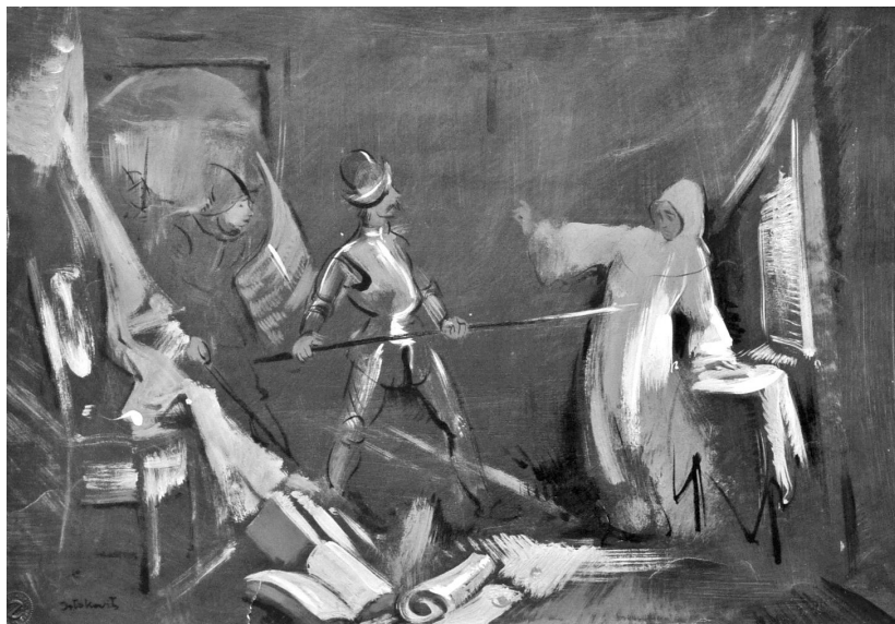
Istókovits Kálmán festménye (SVI, 1. sz. 2353.)

egy oldalra dőlt gyertyatartó áll, rajta egy ráakasztott lámpással, amely a gyertyával egyetemben nem világít, sejtetve ezzel tulajdonosuk halálát. A kép közepén további két zsoldos látható, akik közül az egyik mintha egy fehér leplet rántana le a mennyezetről, ugyanakkor a két alak szándéka kétséges. A kép jobb alsó oldalán az alkotó – hasonlóan a többi művéhez – magát is megjelölte az „ISTOKOVITS K 1947” felirattal.